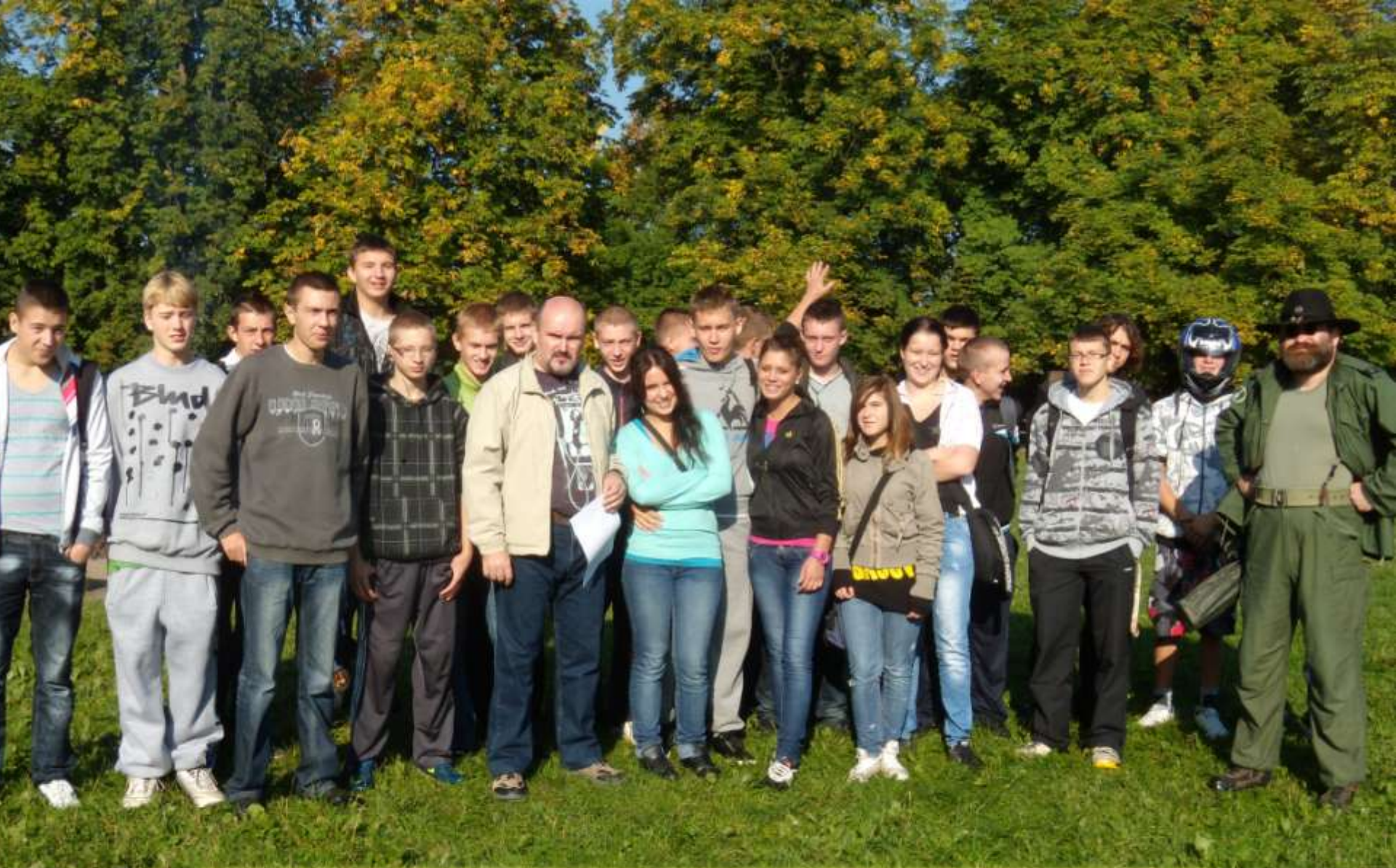
Humory i pogoda dopisywały...